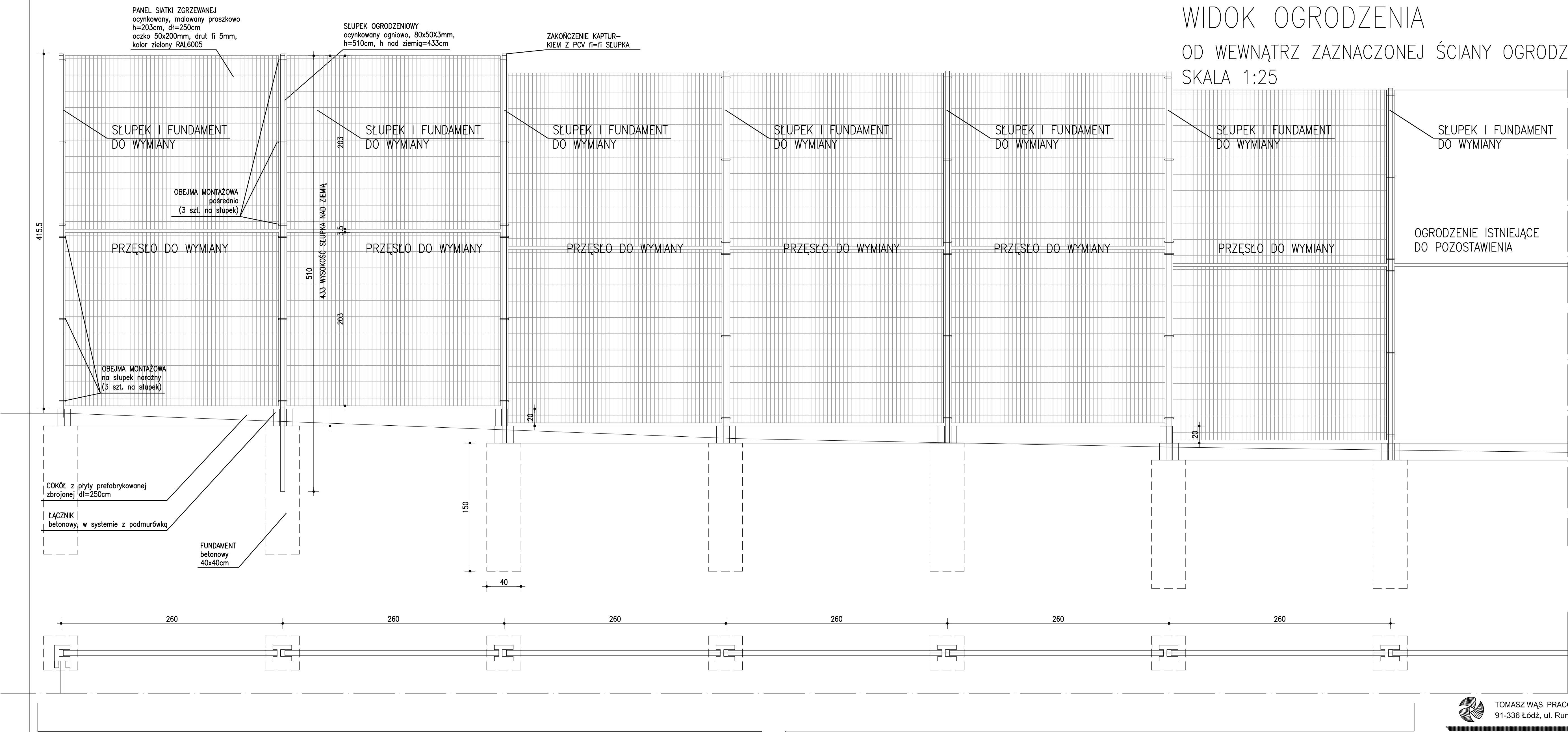
WIDOK OGRODZENIA OD WEWNĄTRZ ZAZNACZONEJ ŚCIANY OGRODZENIA SKALA 1:25