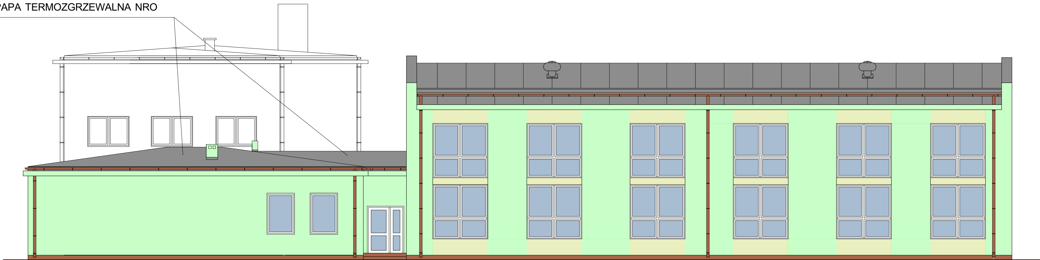
ELEWACJA POŁUDNIOWA 1:100